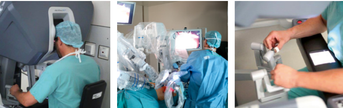
da Vinci®-Operationssystem im Einsatz

Die Klinik für Urologie am Caritas-Krankenhaus St. Josef gehört zu den größten Zentren in Deutschland für roboter-gestützte Operationen. In den letzten drei Jahren wurden über 1000 Eingriffe von zwei Operateuren vorgenommen. Dementsprechend verfügt die Regensburger Klinik über eine äußerst hohe Erfahrung und Expertise. Über kleine Schnitte am Bauch des Patienten werden Kamera und miniaturisierte Instrumente eingeführt. Der Operateur an der Konsole sieht das Operationsfeld dreidimensional und mehrfach vergrößert auf einem Bildschirm.